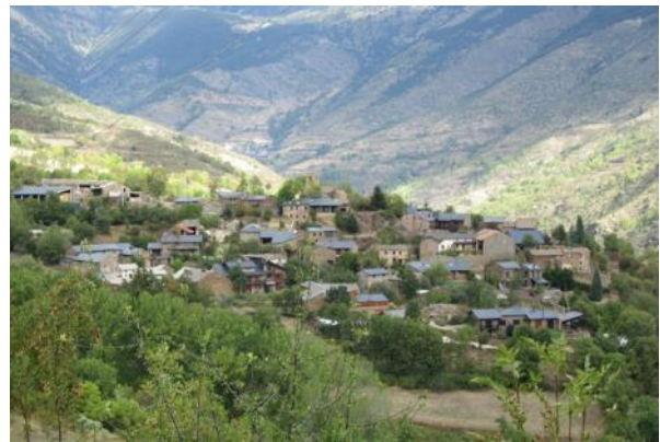
El nucli d'Éller fotografiat l'any 1913 (Font: Imatge de l'arxiu Llaudó) i l'any 2012 (Font: Fotografia de Josep Nogué)