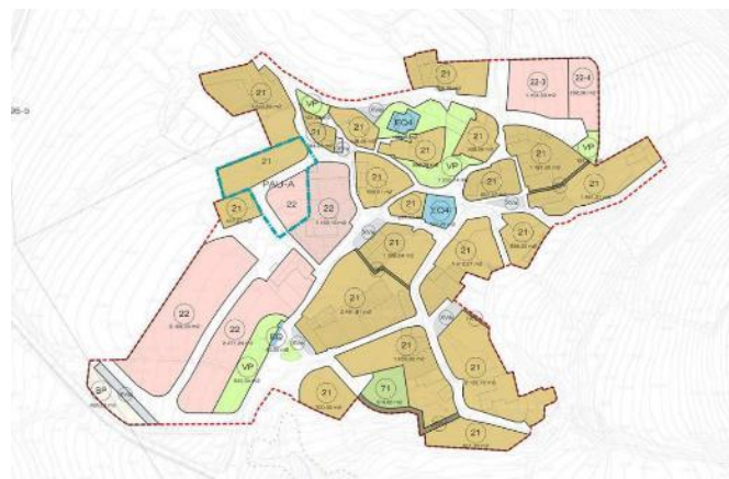
Proposta ordenació del nucli d'Éller.

El POUM de Bellver de Cerdanya està disponible al web de l'Ajuntament al web de l'ajuntament ( http://bellver.ddl.net/poum.php?id=229&id_seccio=6043 ) Pel que fa al nucli d'Éller el POUM identifica dues àrees de potencial creixement, al nord i al sud del nucli.