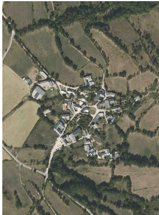
Comparativa de la Vista aèria d'Éller dels anys 1973 i 2019.