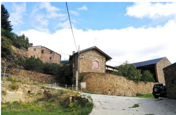
Imatge de la Plaça del poble. S'hi poden observar les edificacions de Cal Tallaferro (esquerra) amb la seva closa d'arbres fruiters i Cal Llaudó (dreta) amb la seva era, pallers i corts.