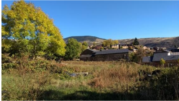
Imatge recent del camp de la font

En totes dues àrees es preveu una densitat de creixement molt més elevada que a la resta del nucli. En la zona nord s'especifica una previsió de 7 habitatges, mentre que en la zona sud no s'estableix la previsió d'habitatges però si que es dibuixa un carrer que atravessaria la zona i que actualment no existeix.